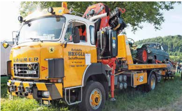
Neben einfachen Lastwagen gibt es auch einige mit Zubehör. So etwa dieses Exemplar mit Hebekran für Autos.