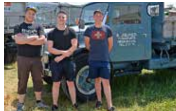
Auch Jüngere finden Gefallen an den alten Lastwagen.